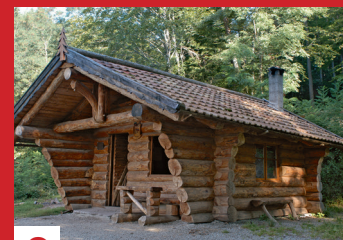
C CHALET DU COL DU SICKERTBACH

plans sont établis par le Mulhousien Jacques Schulé et la direction des travaux est confiée à Léon Reitzer. Les jeunes gens du village, transformés pour l'occasion en manœuvres, en maçons et en artisans, bâtissent l'église. Le sanctuaire agrandi et restauré est inauguré par l'évêque de Strasbourg. A l'intérieur de la chapelle se trouve une statue de style baroque de Saint-Séverin, elle date de 1716 et elle est en bois polychrome. Elle a été restaurée en 1983 par l'artiste peintre Wiederkehr de Sultz.