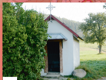
A LA CHAPELLE DES CHOUETTES KUTZAKAPALALA

Construite après la guerre de 1870, elle est connue à Sickert sous le nom de «S'kutzakapala». Les anciens racontent que la statue de la Vierge qui se trouve à l'intérieur est l'œuvre d'un vagabond, qui voulait remercier les villageois qui l'avaient hébergé, il a sculpté dans le bois la statue avec son couteau.