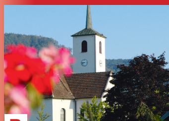
B CHAPELLE NOTRE-DAME DU PERPÉTUEL SECOURS

Construite après la guerre de 1870, elle est connue à Sickert sous le nom de «S'kutzakapala». Les anciens racontent que la statue de la Vierge qui se trouve à l'intérieur est l'œuvre d'un vagabond, qui voulait remercier les villageois qui l'avaient hébergé, il a sculpté dans le bois la statue avec son couteau.