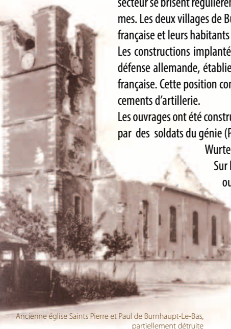
Ancienne église Saints Pierre et Paul de Burnhaupt-le-Bas, partiellement détruite