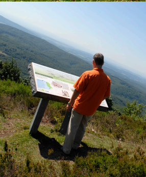
Au sommet de la Planche des Belles-Filles

Les landes et pelouses acidiphiles sont très peu répandues en Franche-Comté. Et celle du Mont Ménard a bien failli disparaître, suite à la déprise agricole et à la recolonisation par la forêt. Des travaux ont permis de sauvegarder ce site, exceptionnel de par la diversité de sa faune et de sa flore.