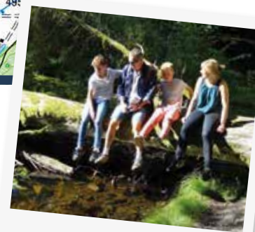
PAUSE FAMILLE AU FIL DE L'EAU